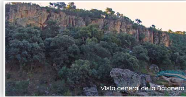
Vista general de la Batanera

Está situada sobre un gran banco cuarcítico de paredes verticales, a 820 m. de altitud, a escasos metros del río Cereceda, entre Sierra Madrona y la Sierra de Hornilleros. El encajonamiento del río da lugar a un precioso paraje natural, con una espesa vegetación, conocido como Chorrera de los Batanes , por la cascada que presenta el río, donde se situaba un antiguo batán .