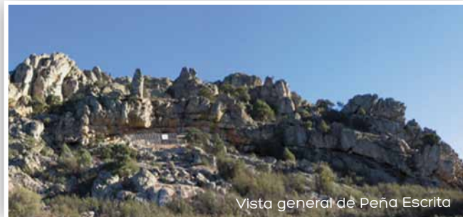
Vista general de Peña Escrita

Se localiza a unos 3 km. de Fuencaliente. en la ladera sur de la Sierra de Hornilleros, a 920 m. de altitud, en las proximidades del arroyo que lleva su nombre. Se trata de un murallón de paredes quebradas, en cada una de las cuales se sitúa un panel con figuras. El lugar goza de una amplia visibilidad, desde donde se divisan el pueblo de Fuencaliente y la sierra y las pinturas de la Serrezuela.