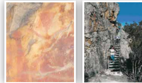
Escorialejo, detalle y escalinata de acceso

se encuentra situado a unos 2 km. de Peña Escrita, en la Sierra de Navalmanzano, pero el camino está cortado por una cadena. A partir de aquí se puede llegar hasta él por dos caminos distintos (a pie): uno largo y de gran belleza y otro corto y de pronunciada pendiente. Las vistas desde el yacimiento merecen el esfuerzo. Está formado por un abrigo y una pequeña covacha, en cuyas paredes aparecen 61 figuras distribuidas en 4 paneles. Su estado de conservación es deficiente.