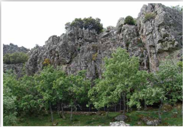
Vista general del abrigo del Morrón del Pino

El Morrón del Pino es el abrigo situado a mayor altitud, unos 1200 m. Se localiza en la vertiente norte de la Sierra de Quintana, en el Valle de Navalmanzano, en un paraje lleno de robles y de extraordinaria belleza. Consta de dos paneles con un total de 17 figuras. El camino debe realizarse parte en todoterreno y parte a pie, a través de una sinuosa senda entre un bosque de robles, donde se pueden encontrar ciervos y buitres.